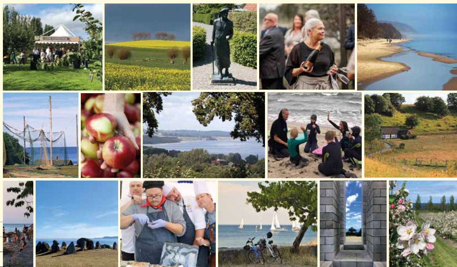
Flera av bilderna kommer från Kiviks Turisms fototävling på Instagram. Alla bilder är tagna i de vackra, lokala omgivningarna runt Kivik.